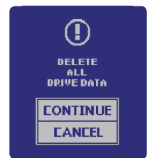
Selbsterstörungs- Modus (Auf Wunsch einstellbar)