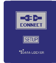
USB 3.0 Schnittstelle (USB 2.0 kompatibel)