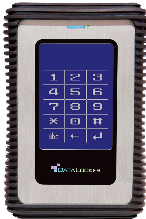
Unterstützt Zwei-Faktor- Authentifizierung durch RFID-Karte (bei der RFID-Version)